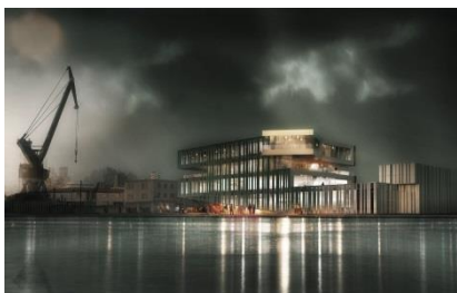
La Maison du Port à La Rochelle