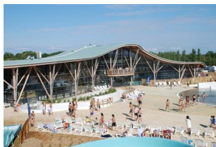
Centre aquatique ILEO à Dolus d'Oléron