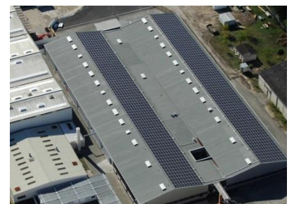
Toiture photovoltaïque de Stelia Aérospace à Rochefort